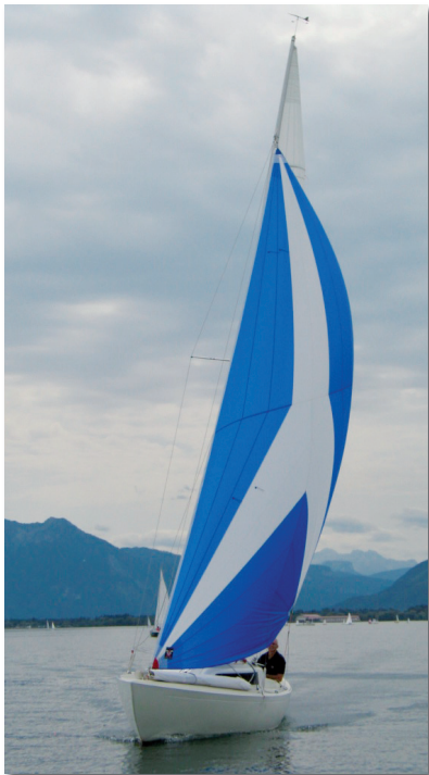
Booster in voller Fahrt. Das Segel bringt Ihr H-Boot auch bei leichtesten Winden mächtig in Fahrt.