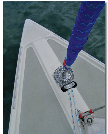
BOOSTER mit Bartels Endlos Rollanlage befestigt am Festmacherbügel am Bug.