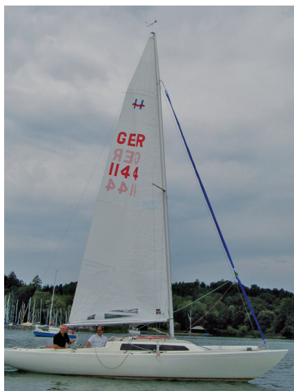
BOOSTER gerollt gesetzt bereit zum segeln.